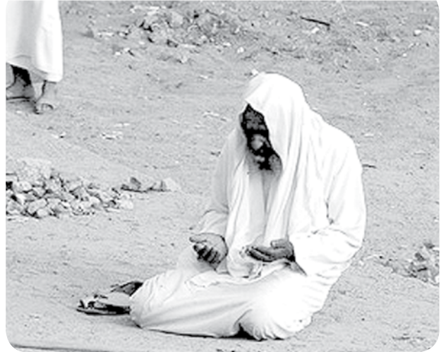
حضرت ایت‌الله حسین مظاهری

آنچه در قلمرو جسم و بدن مکلف است، همان احکام و آداب یک فریضه است که بیان آن به عهده فقه است و آنچه در قلمرو قلب اوست، همان اسرار و بطون یک فریضه است که تبیین آن به عهده "فقه فقه" است. از اینرو این قلب